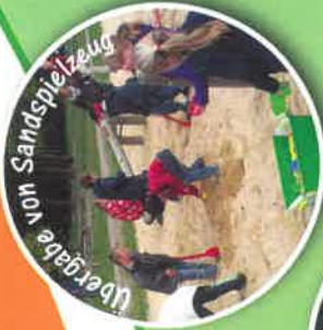
Übergabe von Sandspielzeug

FÖRDERUNG DES FREIZEITANGEBOTES IN DER SCHULE Rope Skipping AG, Musical AG